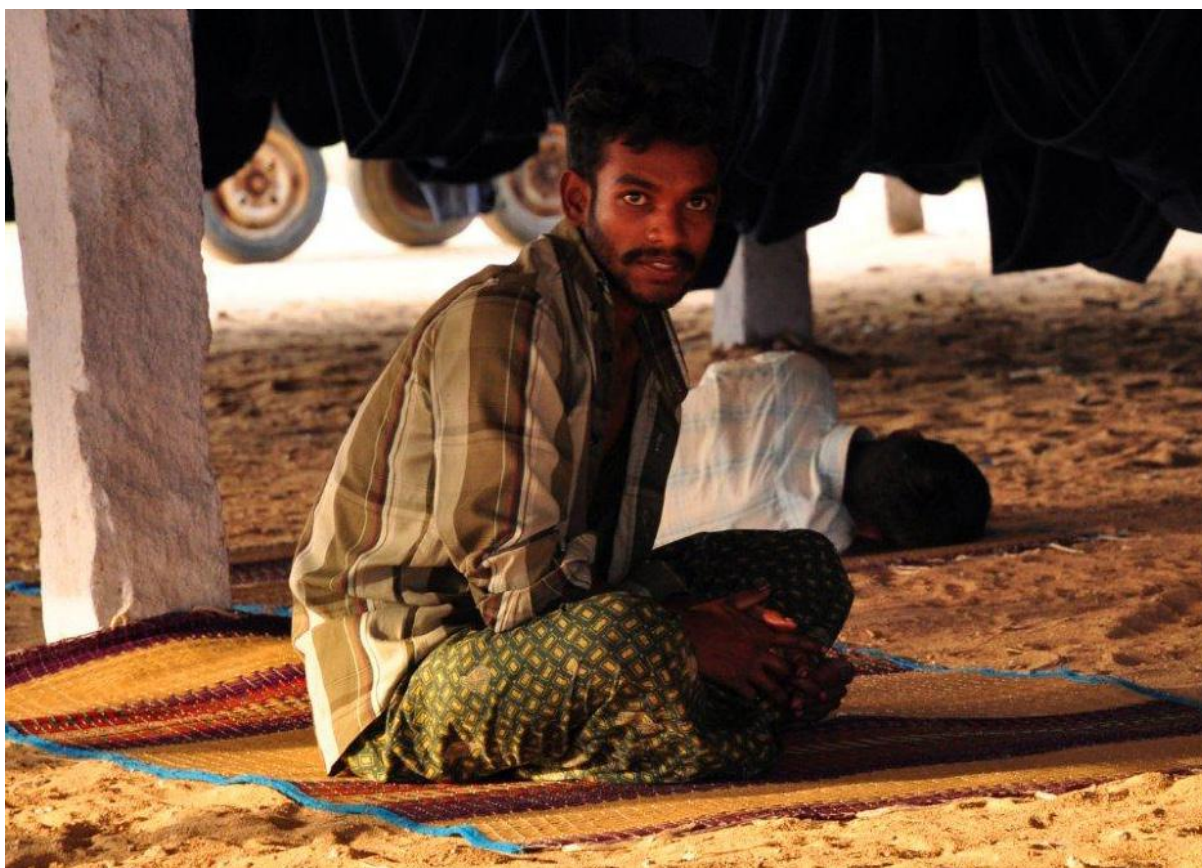
Foto: Timanställd tvätteriarbetare Tiruppur Indien