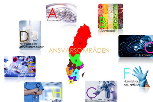
Bild: Ny ansvarsfördelning av våra prioriterade produktkategorier

För att effektivisera arbetet beslutades även att respektive inköpsregion fick nationellt ansvar för en utpekad produktkategori där riskerna är särskilt höga. Ansvaret innebär att ta fram en långsiktig handlingsplan, genomföra avtalsuppföljningar och revisioner, föra leverantörs- och branschdialoger och dela resultat och information med övriga landsting och regioner. Beslut fattades även att utöka våra tidigare sju prioriterade produktkategorier med området livsmedel. Nedanstående bild visar vilka riskområden respektive inköpsregion ansvarar för.