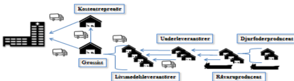
Bild 2: Landsting och regioner tecknar avtal både med grossister och med kostentreprenörer.

Figuren nedan beskriver leverantörskedjan för livsmedel och de vanligaste kedjorna: